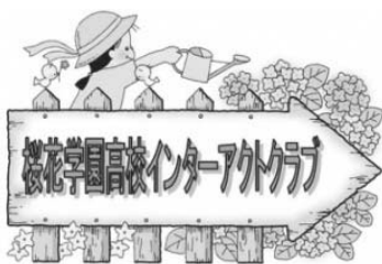
桜花学園高等学校 インターアクトクラブ