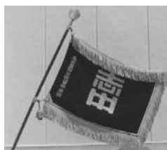
志賀中学校 合唱部