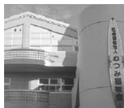
むつみグリーンハウス